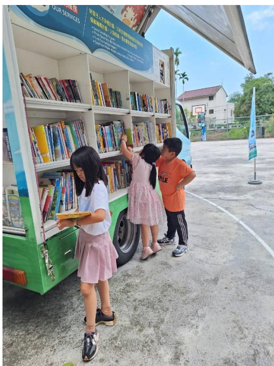
↑每個月一次的雲水書車