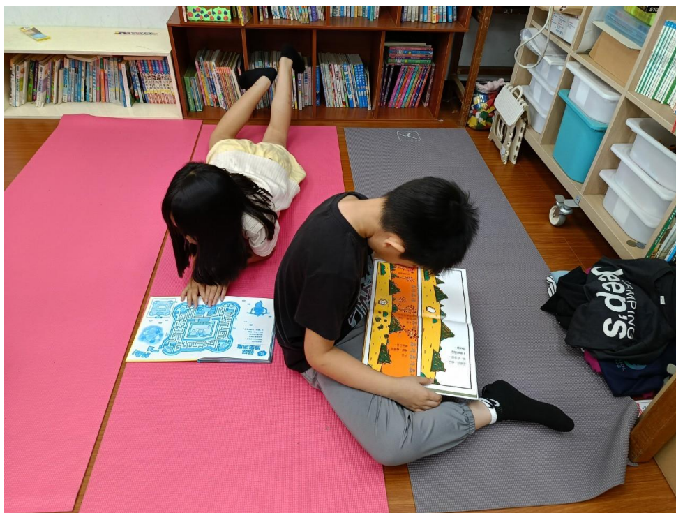
↑專注不受干擾的閱讀