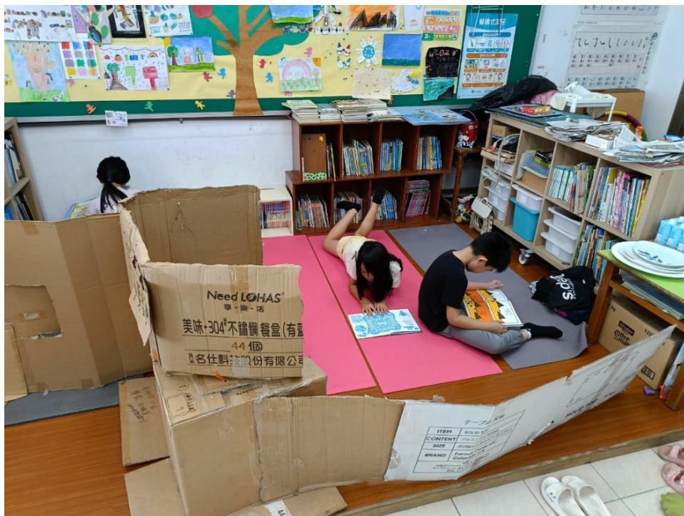
↑學生在自製紙箱屋圍成的閱讀角自由閱讀