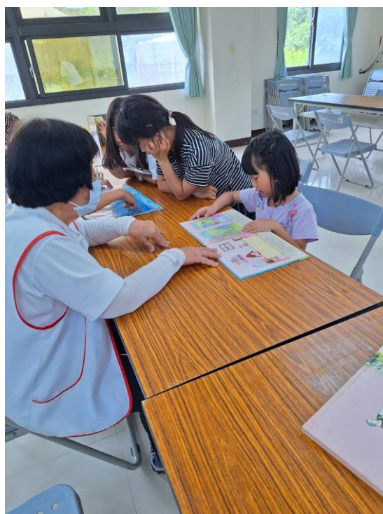
↑雲水書車志工阿嬤帶著低年級孩子閱讀